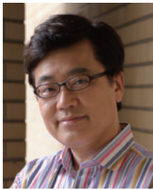
うえだ のりゆき 上田 紀行 文化人類学者