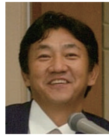
たお やすし 田尾 安志 元中日ドラゴンズ選手

医学博士。東京工業大学教授。リベラルアーツ研究教育院長。「癒し」の概念と思想をいち早く提唱し、日本人の心の行方と社会の変革への提言を、テレビ、新聞等で積極的に行う。著書『生きる意味』(岩波新書)は複数の高校国語教科書にも掲載されているほか、近著に『人生のく逃げ場>会社だけの生活に行き詰まっている人へ』(朝日新書)、『パッとしない私が、「これじゃ終われない」と思ったときのこと』(幻冬舎)、『人間らしさ 文明、宗教、科学から考える』(角川新書)、処女作『覚醒のネットワーク』も昨秋河出文庫にて復刊された。本年より中央教育審議会委員(高等教育)に就任。